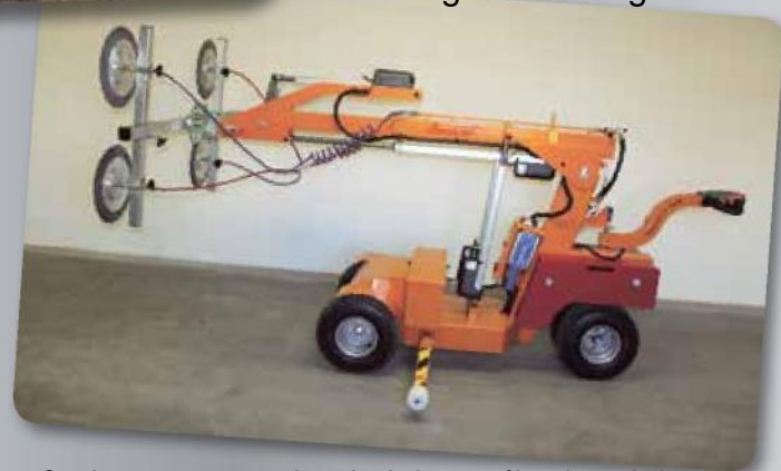
Le SL 608 Outdoor est un nouvel engin de levage électrique de la gamme Outdoor qui, en termes de taille, se place entre le SL 380 Outdoor et le SL 780 Giant